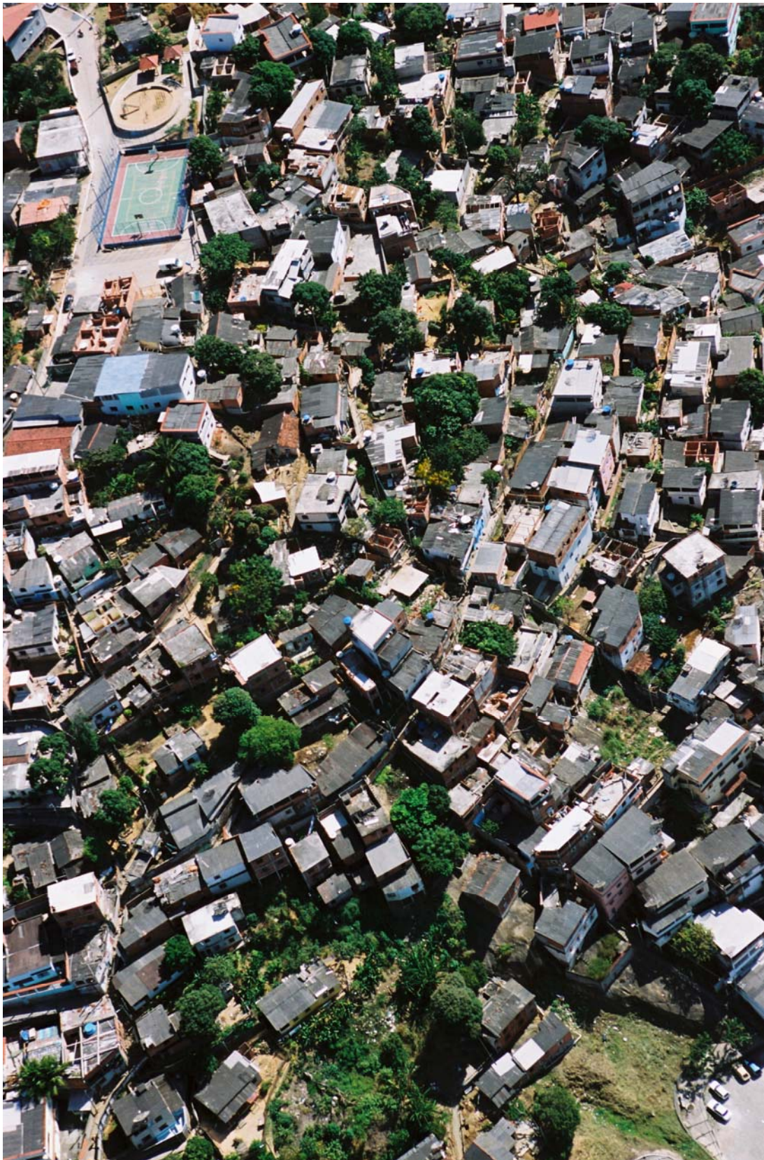
Figura 2 – Fotografia Oblíqua do Morro do Romão.