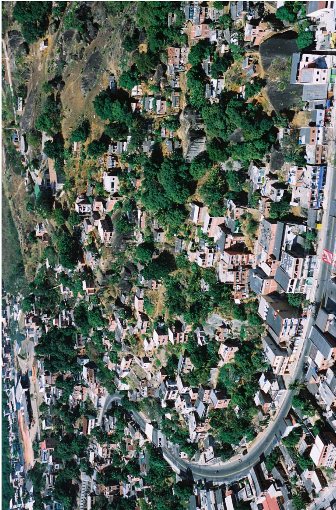
Figura 1 – Fotografia Oblíqua do Bairro Conquista.